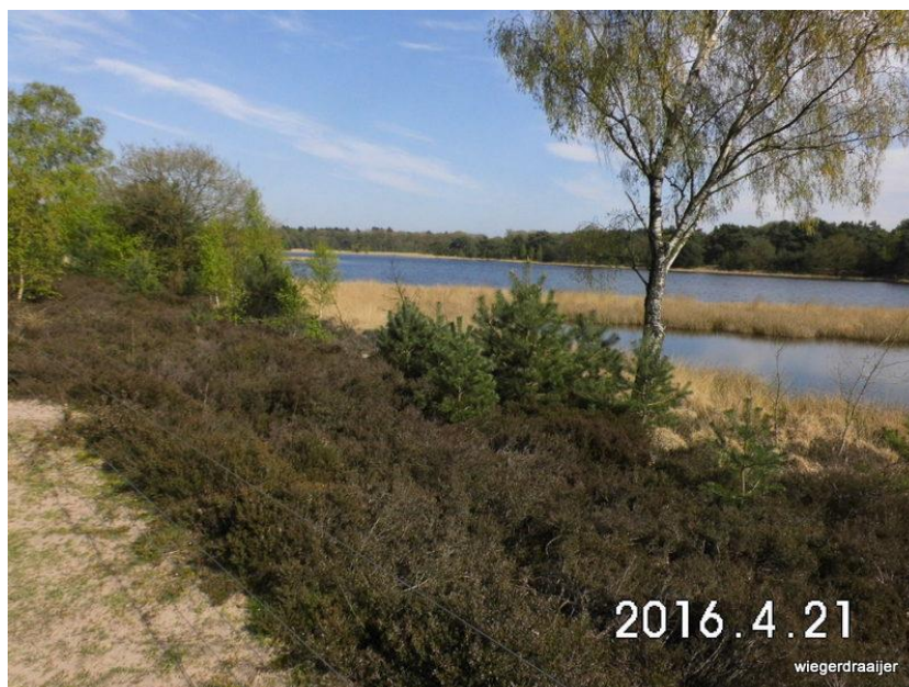
Het gebied bij Oud Meer voor het nieuwe rolstoelpad

In elke vergadering werd een thema behandeld waarbij een externe deskundige werden uitgenodigd. Landelijk wordt gewerkt aan ratificering van VN-Verdrag voor de rechten van mensen met een handicap. In het ROG-ZOB werd dit op de voet gevolgd om hier in het kader van het Inclusief Beleid in gemeenten handen en voeten aan te geven.