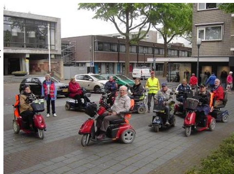
Vertrek vanaf het Raadhuisplein

Natuurlijk zijn er elke keer halverwege op de route ook koffiestops om gezellig bij de te praten. Buiten dit routeseizoen kwam de groep elke maand bij elkaar in D'n Tref op het terrein van Zonhove, om naast gezellig koffie drinken te luisteren en te oefenen. Bijvoorbeeld met bewegen in zittende situatie door een docente die ons oefeningen liet doen. Of actief te zijn met een sjoelcompetitie. Om de activiteiten