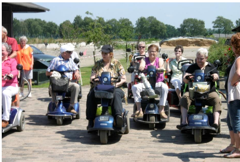
Vertrek "Scoot on Route" vanaf het terras van Zorgboerderij Krakenburg

Na een uitgebreide aanvraag (o.a. een statutenwijziging) ontvingen wij op 8 juni 2016 als CG-Platform van de Belastingdienst de beschikking dat wij een Algemeen Nut Beogende Instelling (ANBI) zijn geworden. De ingangsdatum is met terugwerkende kracht 1 januari 2016. De ANBI erkenning is belangrijk voor mensen, organisaties en bedrijven die ons willen sponsoren of op een andere manier met een gift willen verblijden. Het geldbedrag wat geschonken wordt kan dankzij deze ANBI status opgevoerd worden als kosten bij de aangifte van de belasting. Ook is een ANBI-status van belang voor mensen die in de WW zitten. Zij mogen geen vrijwilligerswerk doen tenzij de organisatie een ANBI is.